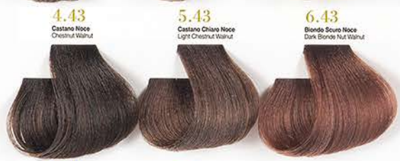
4.43 Castano Noce Chestnut Walnut