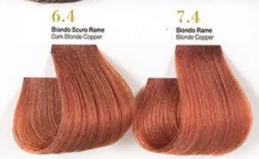
6.4 Biondo Scuro Ramo Dark Blonde Copper