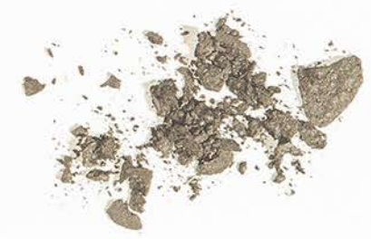
9.07 Sabbia Sand