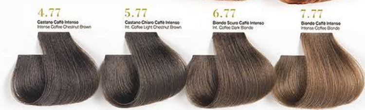
4.77 Castano Caffè Intenso Intense Coffee Chestnut Brown