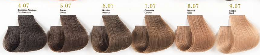
4.07 Cioccolato Fondente Dark Chocolate