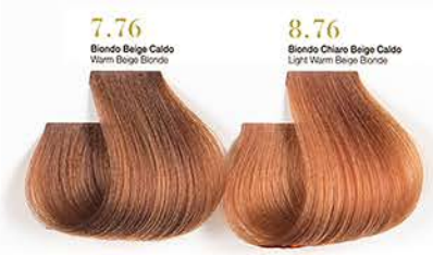
7.76 Biondo Beige Caldo Warm Beige Blonde