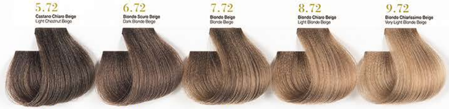
5.72 Castano Chiaro Beige Light Chestnut Beige